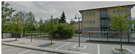
Sede Mantegna , via Graziano 6 (S. Angelo)

LINK per accedere al modulo di registrazione ed a quello di iscrizione: www.istruzione.it/iscriziononline/