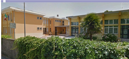
Sede Felissent , via Caduti di Cefalonia 19

Le sedi Felissent e Mantegna hanno un solo codice meccanografico: TVMM87201P